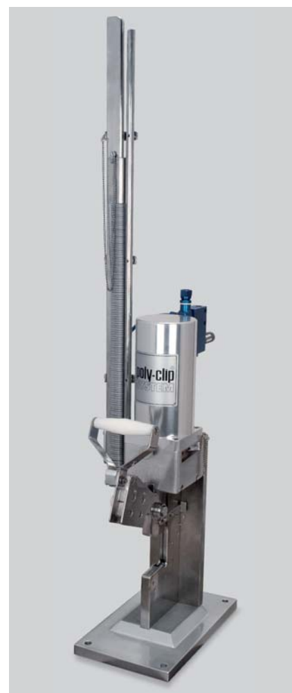
SCD 8012/10012: Máquina vertical