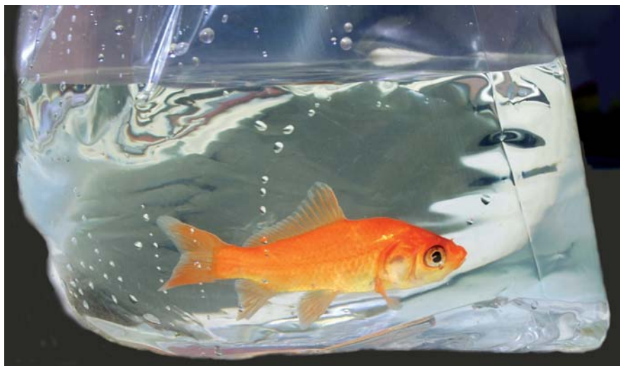
Ideal para embalagens de peixes ornamentais.

Máquina pneumática especial para fechamento de produtos tais como tapetes, tecidos, sucos, produtos químicos. Disponível na versão vertical ou horizontal.